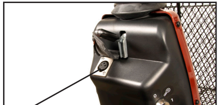
Laddningskontakten ansluts till 3-polskontakt på styrstängan. Laddningskontakten är placerad under skyddsplåten.