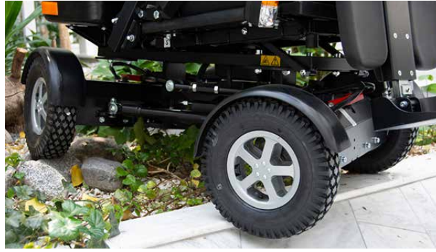
Joustava ja kääntyvä etu- ja taka-akseli