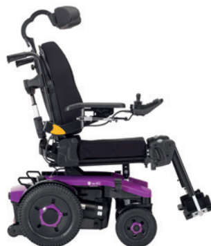
AVIVA RX 40 + Modulite HD

Ihanteellinen ratkaisu niille, jotka käyttävät tuolia yhtä paljon ulkona kuin sisätiloissa ja / tai tarvitsevat enemmän kliinistä tukea.