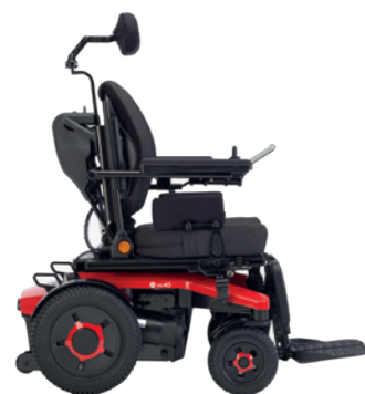
AVIVA RX 40 + Ultra Low Maxx

Suurempi maksimi käyttäjäpaino ja leveät istuinvaihtoehdot tekevät HD:sta sopivan suuremmalle asiakaskunnalle..