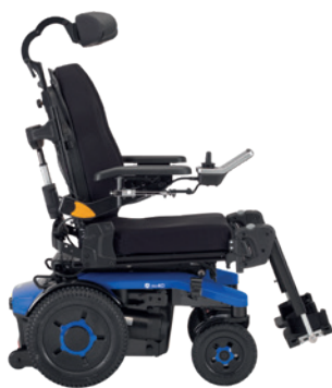
AVIVA RX 40 + Modulite

Lähtötason tuoli, jossa loistava liikkuvuus sisätiloissa, ihanteellinen niille, joilla vähemmän kliinisiä erikoistarpeita.