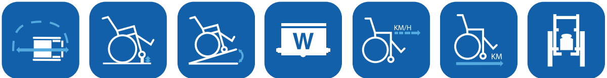
Kääntösäde halkaisija ▼ Max. esteenylityskyky ▼ Max. kallistus ▼ Moottori-kapasiteetti ▼ Nopeus ▼ Ajomatka ▼ Kokonaispaino ▼