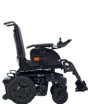
AVIVA RX 20 + One piece