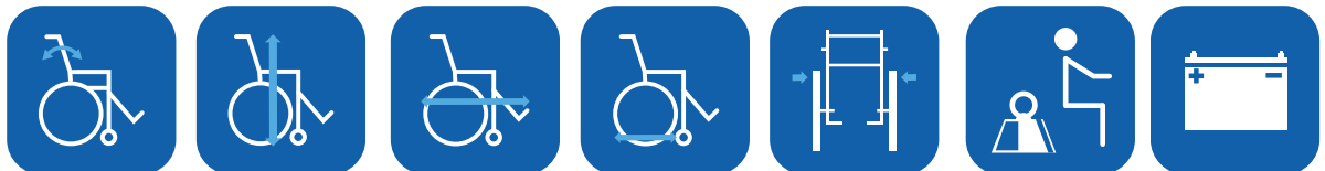
Selkäosan kulma ▼ Kokonaiskorkeus ▼ Kokonaispituus sis. jalkatuet ▼ Kokonaispituus ei jalkatukia ▼ Ajoyksikön leveys ▼ Max. käyttäjäpaino ▼ Akku-kapasiteetti ▼