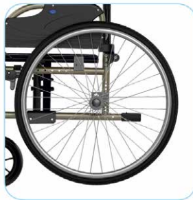
Puhkeamattomat kelauspyörät alukelausvanteilla ja pikakiinnitysnavoilla