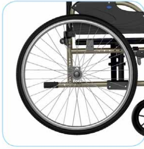
Säädettävä istuinsyvyys Istuinsyvyys säädettävissä +/- 11 cm.