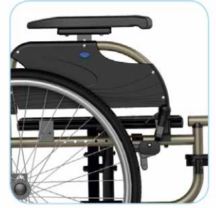
Säädettävät käsituet Siirtymisiä helpottaa sivulle kääntyvät, irrotettavat, korkeussäädettävät käsituet sis. vaatesuojat ja pitkät käsitukipehmusteet.