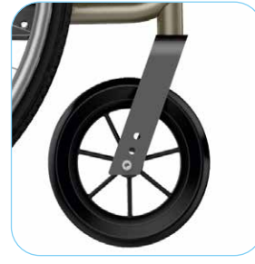
Säädettävät tukipyörät 7" / 170 x 40 mm mustat, kiinteät PU-tukipyörät 3 eri korkeuteen säädettävillä alumiinihaarukoilla.