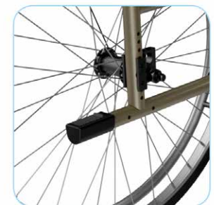
Polkaisuputki pyörätuolin taakseallistukseen