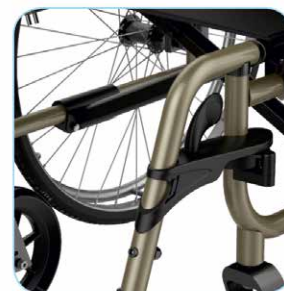
Kokoontaitettava ristikkorunko helpottaa kuljetusta ja varastointia.