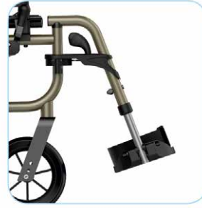
Säädettävät jalkatuet Jalkatuet kääntyvät ulos, sisään, ja alle. Irrotettavat, ylöskääntyvät kulma- ja kork.säädettävät jalkalevyt, joissa kantaremmit.