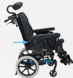
DSS -toiminto (Dual Stability System) vähentää hankausta kallistettaessa.