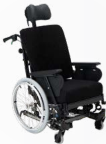
Dahlia 30° itsepotkuteltava: istuinkorkeus 325 - 500 mm.