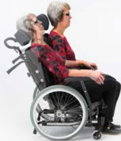
Dahlia 30° Henkilöille, jotka haluavat aktiivisesti vaihdella asentoa itse.