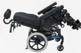
Dahlia 45° Optimaalinen paineenkevennys ja asennonvaihtelu.