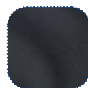
Black PU TR26