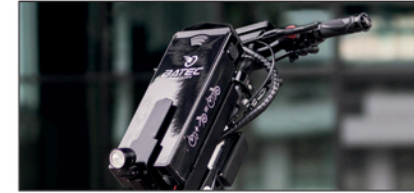
Ajomatka 22 km* 36v – 280 Wh akulla. Ajomatka 40 km* 36v – 522 Wh akulla. 4A Laturi.