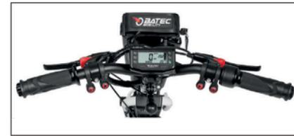
Matta musta alumiini ohjaustanko kokoontaittomekanismilla.