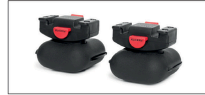
Irrotettavat QR -painot.