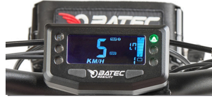
Uusi LCD-näyttö mustalla taustalla help