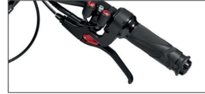
Uusi jarrutusjärjestelmä: seisontajarrut sekä sähköinen alamäkijarru.