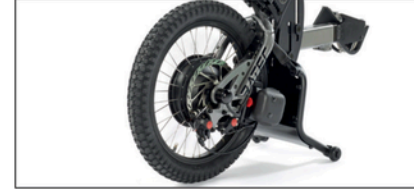
18” ultra-grip rengas ja alumiini-double-wall vanne