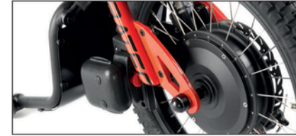
Pikairrotus oikealla helppoon sisäkumin tai renkaan vaihtoon