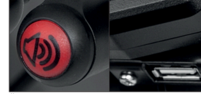
Äänitorvi ja USB-portti.