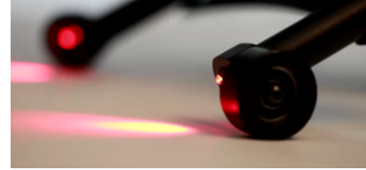
Vilkkuvat jarruvalot: Seisomatelineen takavalot vilkkuvat jarrutettaessa, kun valot ovat päällä.