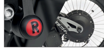
250 RPM 900W korkean vääntömomentin hiiliharjaton moottori + peruutusvaihte. Max. 25 Km/h.