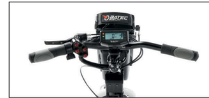
Hemi-ohjaustanko yhden käden (vasen tai oikea) jarruvivulla hemipleegikoille.