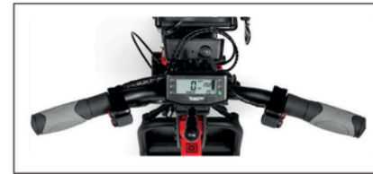
G&B ohjaustanko ilman jarruvipuja tetrapleegikoille.