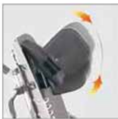
863 Päätuiki Occipital-parietal + 853 Liivivyö . Korkeus- + leveys-säädettävä, kallistus, eteenpäin ja taaksepäin