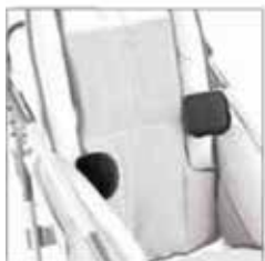
838 Sivutuet , pehmustetut