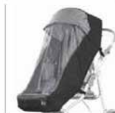
825 Sadesuoja Käytetään 819 kuomon kanssa