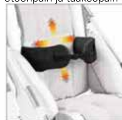
868 Sivutuet , vartalon ympärille kiinnitettävät, joustavat sivutuet. Säädettävä korkeus ja leveys