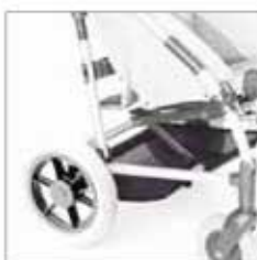
858 Verkkokori alas