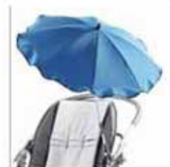
854 Aurinkovarjo , yhteensopiva väri päällisen värin kanssa