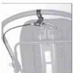
905 Käsijarru (takanäkymä)