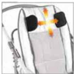
852 Päätuiki sivutuilla. Korkeus- ja leveys-säädettävä