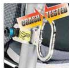
891 4-piste-taksi-koukusetti eteenpäin suunnattuun kuljetukseen moottoriajoneuvossa (autot, paketti-autot, linja-autot)