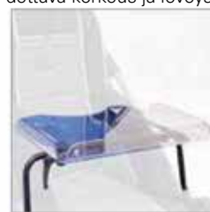
824 Tarjotin , läpinäkyvä