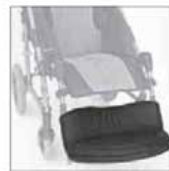
892 Jalkalaudan pehmustettu päällinen