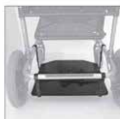
911 Kuljetustaso , lääketieteellisten laitteiden kuljetamiseen (takanäkymä)