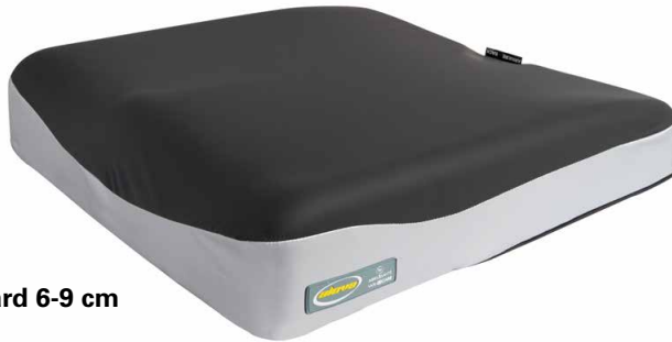
Standard 6-9 cm