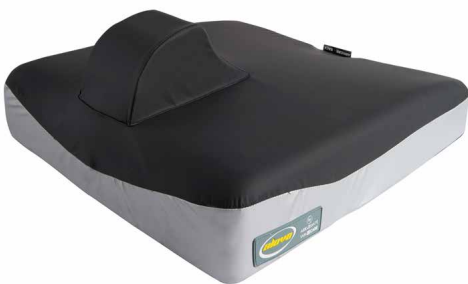
Haarakiila 6-9 cm