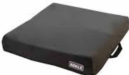
Ergonomic 9-12 cm