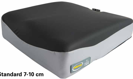
Standard 7-10 cm