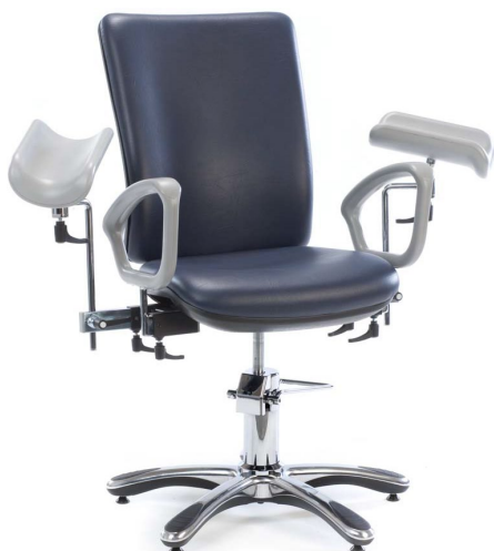
Näytteenottotuoli MC6154 & MC6155