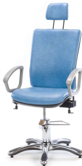
Behandlingsstol med huvudstöd MC6172