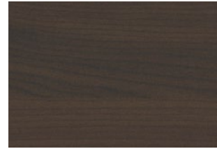
Maple After Eight