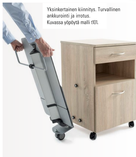
Yksinkertainen kiinnitys. Turvallinen ankkurointi ja irrotus. Kuvassa yöpöytä malli t101.