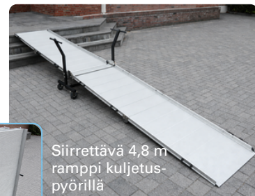
Siirrettävä 4,8 m ramppi kuljetus- pyörillä