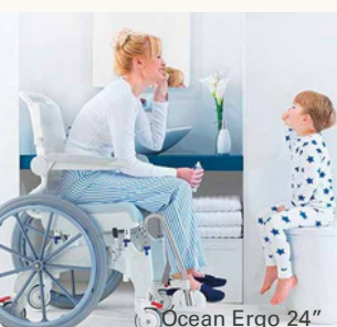
Ocean Ergo 24"

Kun haluat vuokrata, ota yhteyttä: info@campmobility.fi tai puh. 09 350 76 310 (ma-pe 8-16)