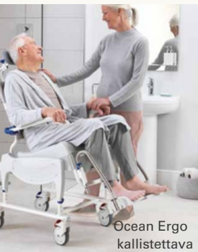
Ocean Ergo kallistettava